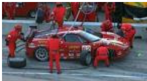
Video: Team Building

Kurz gesagt: Wie unterstützen Sie mit wenigen Ressourcen Ihre Teams pragmatisch und wirkungsvoll bei der Bewältigung ihrer aktuellen Business-Herausforderungen?