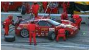
Video: Team Building

Innovativ und effizient: Team-Turbos sind die Beschleuniger für Wachstum und Ergebnisse in Ihren Teams. Mit dieser neuen Form der Team- und Leadership-Entwicklung vertiefen Sie die Inhalte aus den FranklinCovey-Programmen nachhaltig. Und weil Sie dabei Ihre bestehenden Team-Meetings nutzen, sparen Sie Aufwand, Zeit und Kosten.